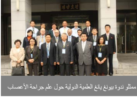
ممثلو ندوة بيونغ يانغ العلمية الدولية حول علم جراحة الأعصاب

① أوفدت الجمعية أكثر من 90 شخصا من أعضائها يكونهم أفراد الوفد إلى الندوات العلمية الطبية الدولية الجارية على نطاق العالم والمنطقة لأكثر من 40 مرة في الفترة ما بين عامي 1980 و1990.