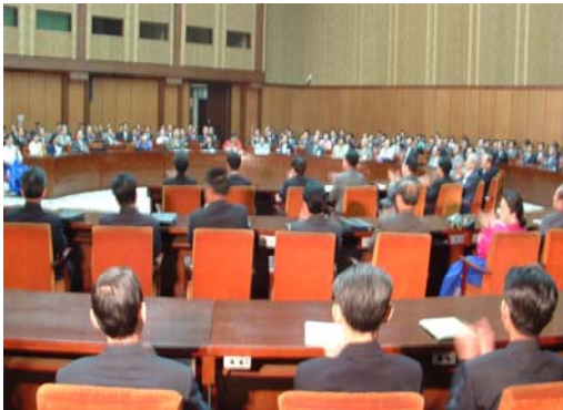
الدورة الحادية والعشرون من ندوة بيونغ يانغ لعلوم الطب للمواطنين في داخل البلاد وخارجها

③ في الفترة ما بين عامي 1999 و2019، استضافت الجمعية ندوة بيونغ يانغ لعلوم الطب التي اشترك فيها علماء الطب الكوريون المقيمون في الولايات المتحدة واليابان، لغرض تطوير الطب القومي الكوري إلى المستوى العالمي تحت التعاون مع علماء الطب الكوريين المقيمين في الخارج.