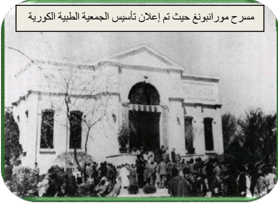
مسرح مورانبونغ حيث تم إعلان تأسيس الجمعية الطبية الكورية

ألقاها الرئيس كيم إيل سونغ شخصيا للمرتين في يوم 13 من شباط/ فبراير ويوم 19 من حزيران/ يونيو عام 1970، وتطورت في عام 2017 إلى تحالف الأطباء الكبير الذي ينضم 80 ألف شخص إليه ولديه 75 فرعا حسب الأقسام الاختصاصية وتشمل نشاطاتها مجمل ميادين العلوم والتكنولوجيا الطبية لجمهوريتنا مثل أبحاث العلوم الطبية والممارسة السريرية بواسطة نظام التوجيه والإدارة المنسق القائم من المركز حتى أدنى الوحدات.