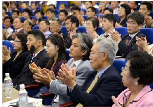
الدورة العشرون من ندوة بيونغ يانغ لعلوم الطب للمواطنين في داخل البلاد وخارجها