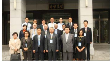
Vertreter des Pyongyanger Internationalen Symposiums über Neurologie

① Von 1980 bis 1990 wurden über 40 Male Delegationen aus 90 Personen an die internationalen Symposien über Medizinwissenschaft in Welt- und Regionalmaßstab abgeschickt.