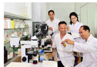
Gemeinsame Operation, Forschung, technische Entwicklung durch die KGM in der Welt