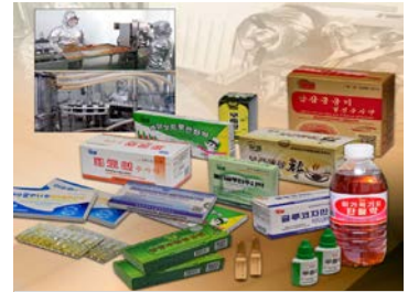
Wirksame Koryo-Medikamente und medizinische Geräte von pharmazeutischen Werkstätten und Fabriken