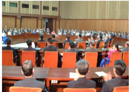
21. Pyongyanger Symposium über Medizinwissenschaft der Landsleute im In- und Ausland